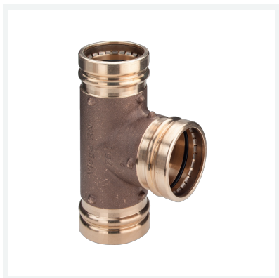
Sanpress XL LF-T-Stück mit SC-Contur labs-frei (Einzelverpackung) Modell 2218XLLF Artikel 432 386