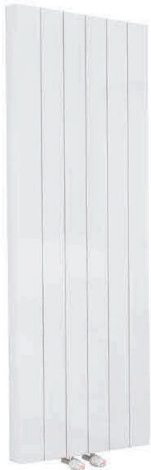
Abbildung: Modell Standard