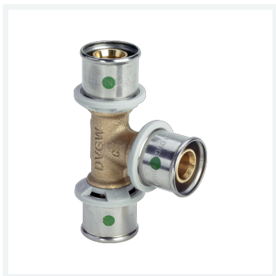
Sanfix P-T-Stück mit SC-Contur - Pressanschlüsse Modell 2118