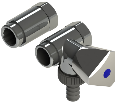
Abb. Art.- Nr. 1725

Artikelnummer: 00 1725 2050 001 mit Standardgriff 00 7125 2050 001 mit Designgriff