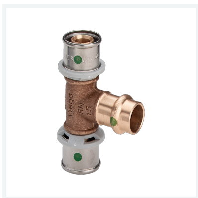
Sanfix P-T-Stück mit SC-Contur Modell 2118.3 Artikel 440 213