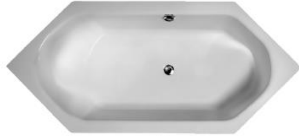
S 114 (Überlauf in Sitzrichtung links)