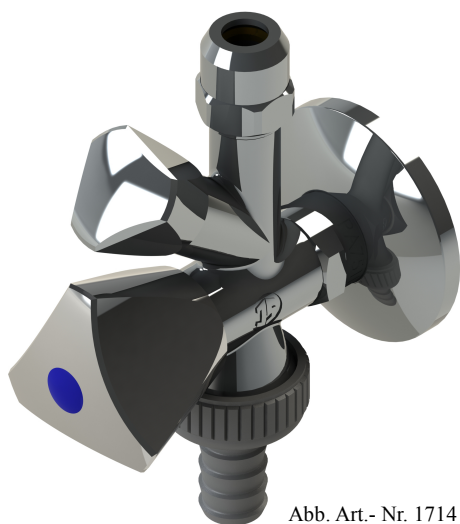
Abb. Art.- Nr. 1714

Artikelnummer: 00 1714 1550 001 mit Standardgriff 00 7114 1550 001 mit Designgriff