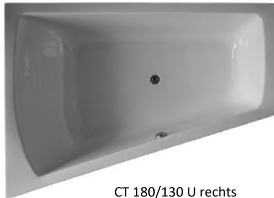
CT 180/130 U rechts