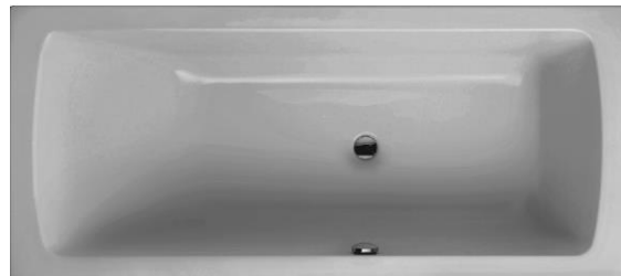
CT 180 (Überlauf in Sitzrichtung rechts)