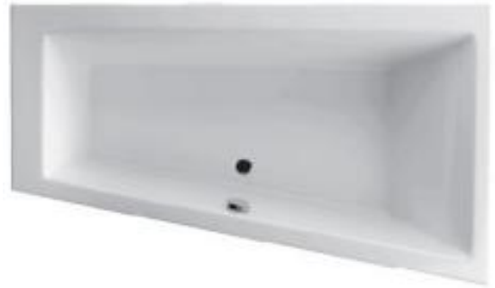
SN 160/95 U rechts