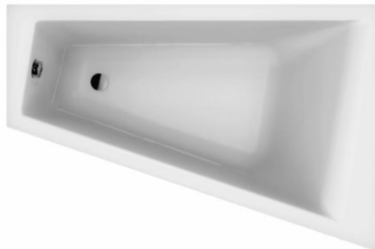
SN 150/100 U rechts