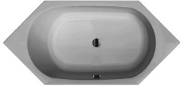
CT 190 S (Überlauf in Sitzrichtung rechts)