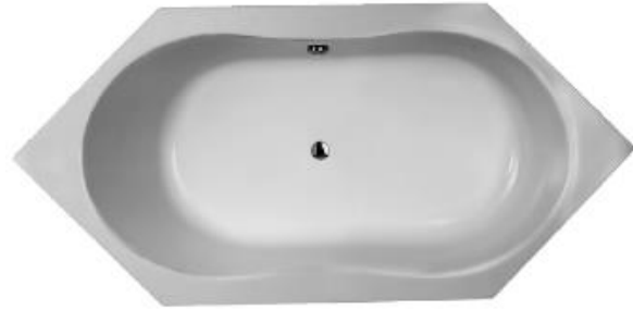
S 115 (Überlauf in Sitzrichtung links)